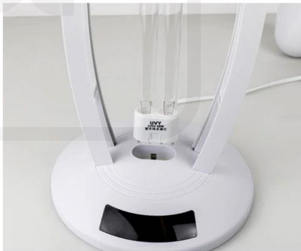
2. Zamenite cevi