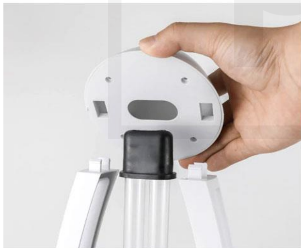
1. Skinite šrafove i otvorite gornji poklopac